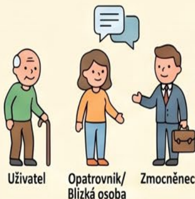
Uživatel Opatrovník/ Blízká osoba Zmocněnec